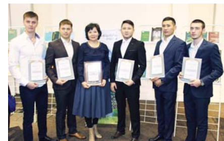
ПОДВЕЛИ ИТОГИ АКЦИИ