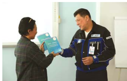
ВИЗИТ РЕКТОРА ПГУ