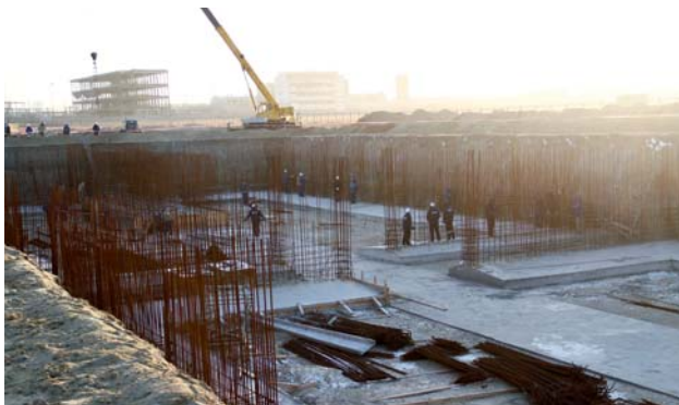
Строительная площадка УПНК

Совместно с китайской компанией NFC-China павлодарское ТОО «УПНК-ПВ» реализует проект «Строительство установки прокатки нефтяного кокса в г. Павлодар». 20 мая этот объект и наш завод посетил президент NFC-China Ванг Хонциань.