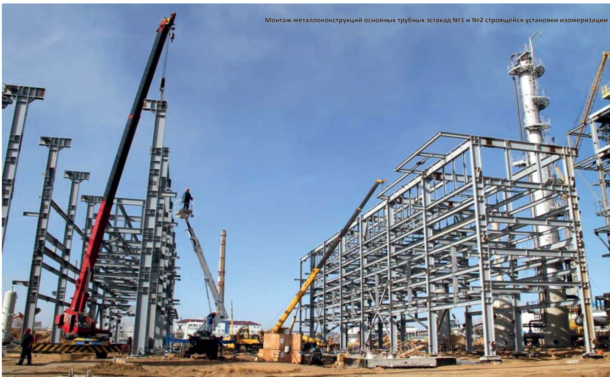
Монтаж металлоконструкций основных трубных эстакад №1 и №2 строящейся установки изомеризации