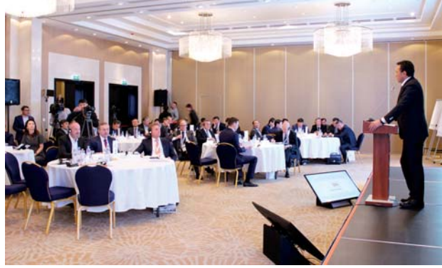
Выступает председатель Правления АО НК «ҚазМұнайГаз» Сауат Мынбаев

О состоянии безопасности и охраны труда в ҚМГ, целях нацкомпании в данной области на 2015–2020 годы и роли руководителей в воспита-