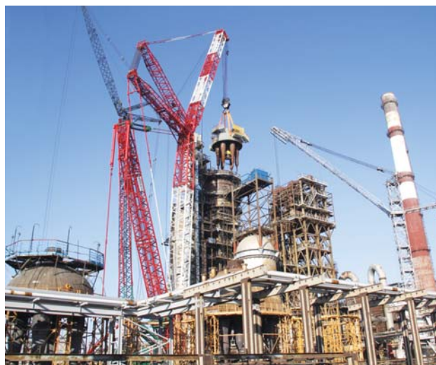
Комплекс глубокой переработки нефти, реакторно-регенераторный блок установки каткрекинга. ОАО «ОМУС-1» производит монтаж верхнего днища реактора Р-201 со сборными камерами и группами циклонов

Только за последние пять лет работы по проведению планово-предупредительных капитальных ремонтов и два года работ по реконструкции существующих установок ПНХЗ заключил с компаниями Российской Федерации договоров на общую сумму