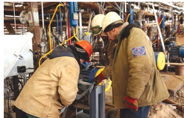
Подрядные работы выполняет ОАО «ОМУС-1»

Кроме договоров на поставку оборудования активно идет сотрудничество по линии оказания проектных, образовательных, инжиниринговых и разного рода производственно-промышленных услуг. Сумма контрактов с российскими поставщиками услуг, затраченная ПНХЗ на эти цели, составила 280 млн рублей.