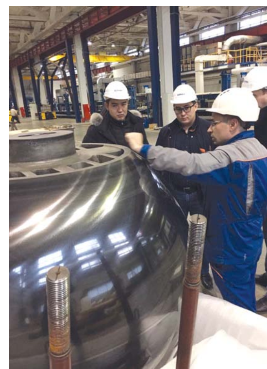
Посещение одной из производственных площадок АО «КОНАР» – линии никелирования