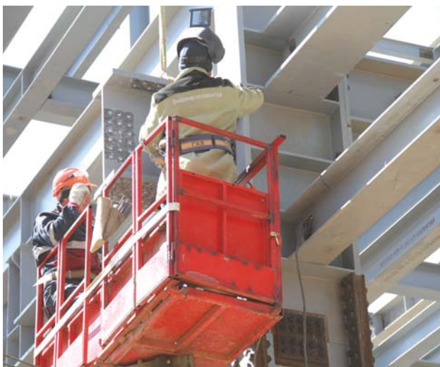
Работники АО «ВТМ» выполняют сварные работы на металлоконструкциях установки изомеризации и сплиттера нефти

ся на заводе в 2009 году. В рамках проекта модернизации возведены несколько производственных комплексов: комбинированная установка изомеризации и сплиттера нефти, комплекс установок производства серы, объекты общезаводского хозяйства.