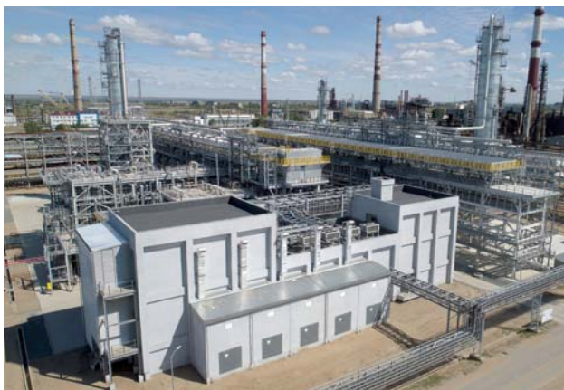
Установка изомеризации и сплиттера нефти