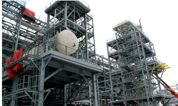
Комбинированная установка изомеризации и сплиттера нефти

В этом году мы завершаем механическую сборку оборудования на двух новых установках: изомеризации и сплиттера нефти и производства серы проекта модернизации ПНХЗ.