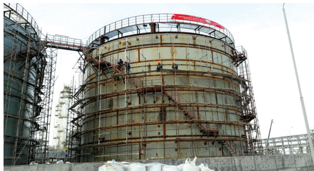
Установка производства серы