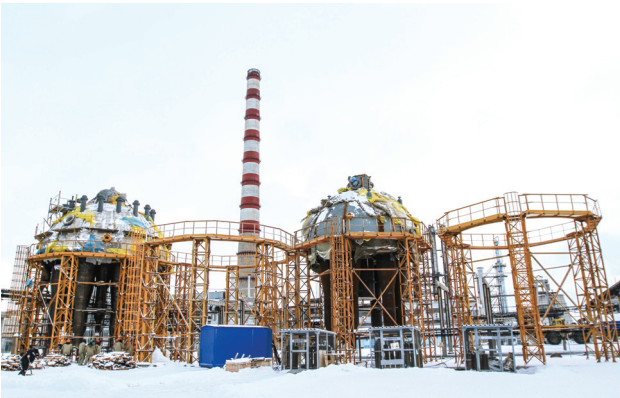
Реакторно-регенераторный блок комплекса глубокой переработки нефти (КГПН) – КТ-1