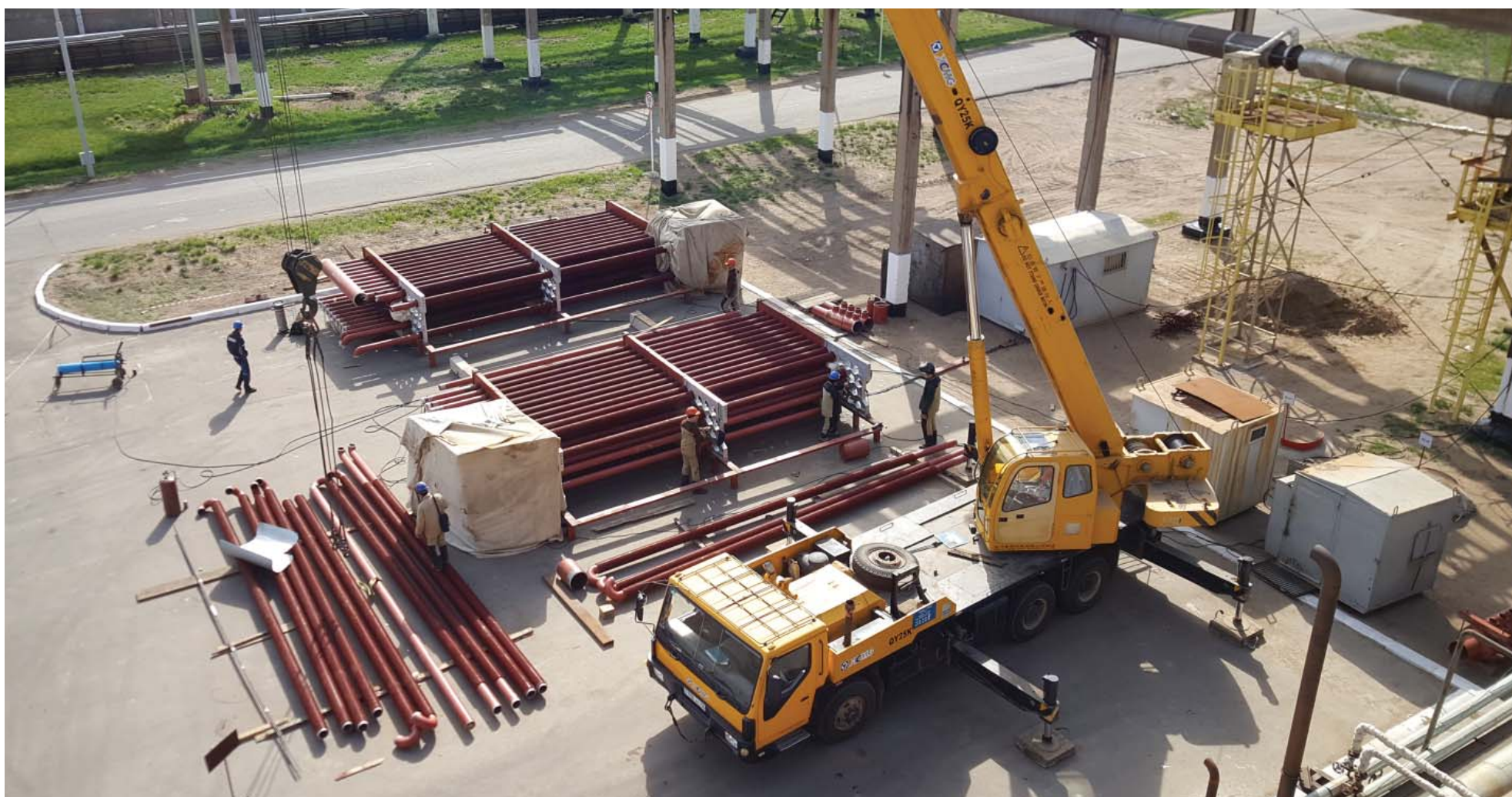
Работники РСМУ производят сборку пакетов конвекции печи П-203 С-200 (КППН)