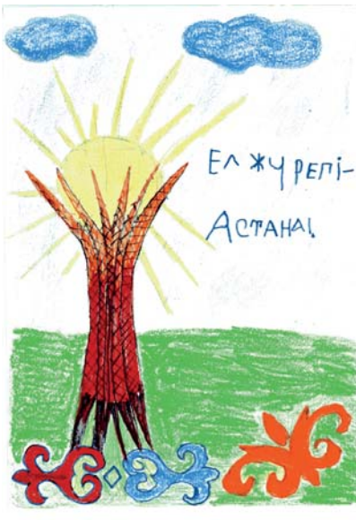
Владислав Корнейчук, 5 лет