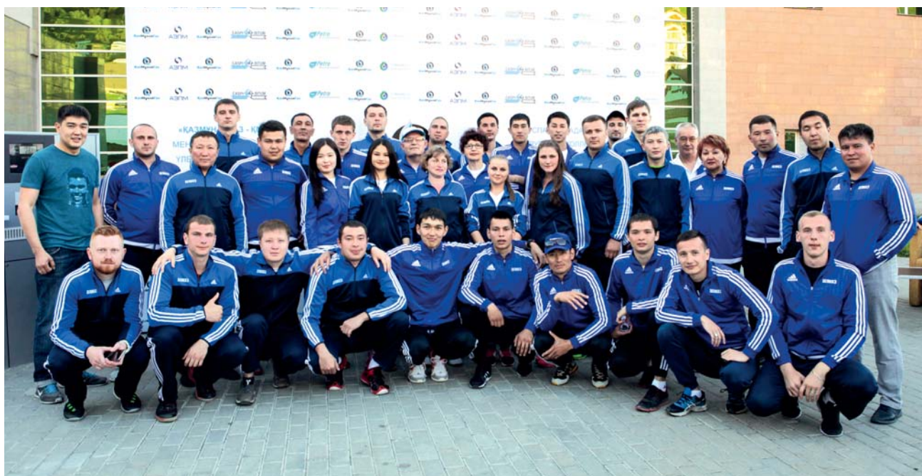
Команда ТОО «Павлодарский нефтехимический завод»