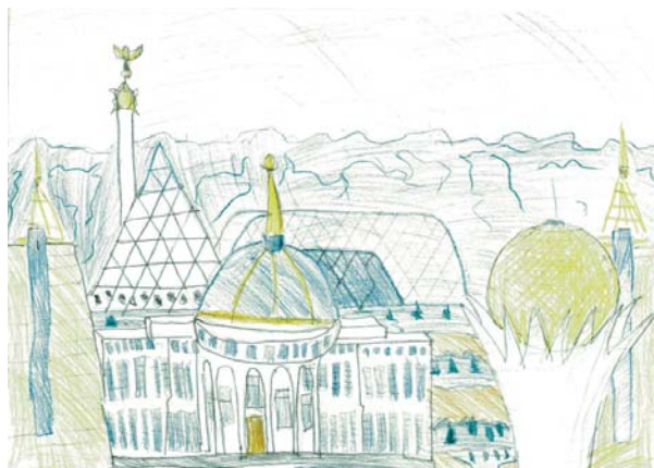
Мади Мурат, 13 лет