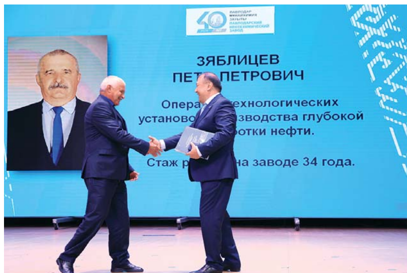
На чествовании ветеранов завода-пенсионеров ПНХЗ в ГДК им. Естая

Празднику не смогла помешать даже дождливая погода: виновники торжества, горожане и гости города провели юбилейную дату ПНХЗ незабываемо!