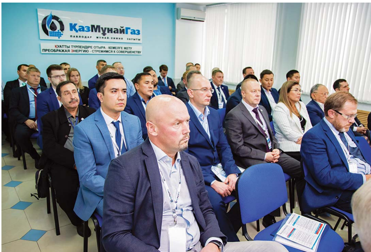
Секционное заседание «Оборудование НПЗ. Автоматизация производственных процессов. Передовые решения»