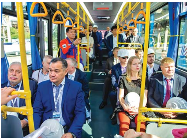
Экскурсия по заводу