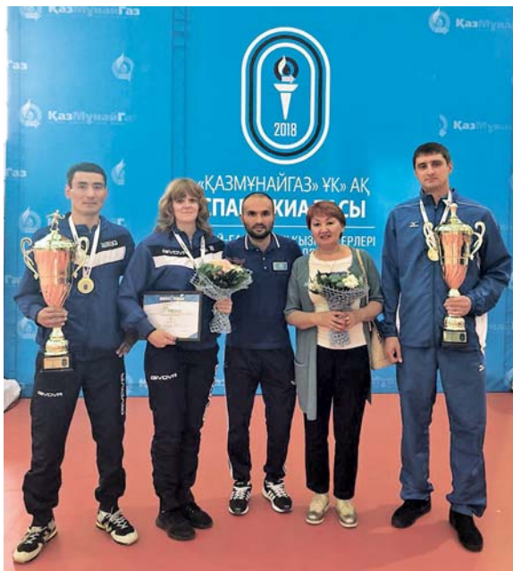
Заводчане – золотые призеры спартакиады