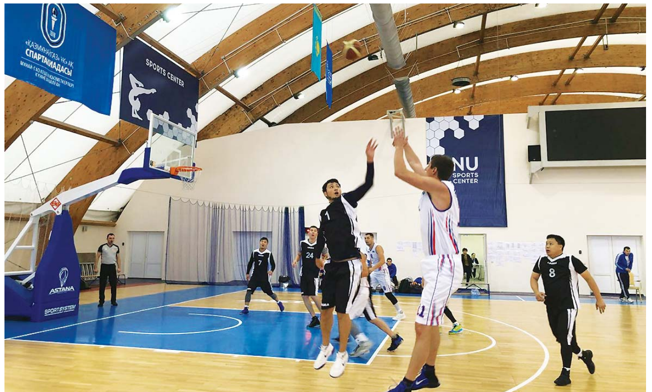
Баскетболисты ПНХЗ в борьбе за золото