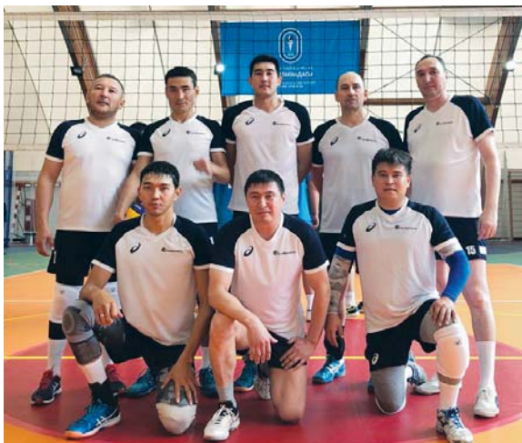
Волейбольная команда ТОО «ПНХЗ» – I место