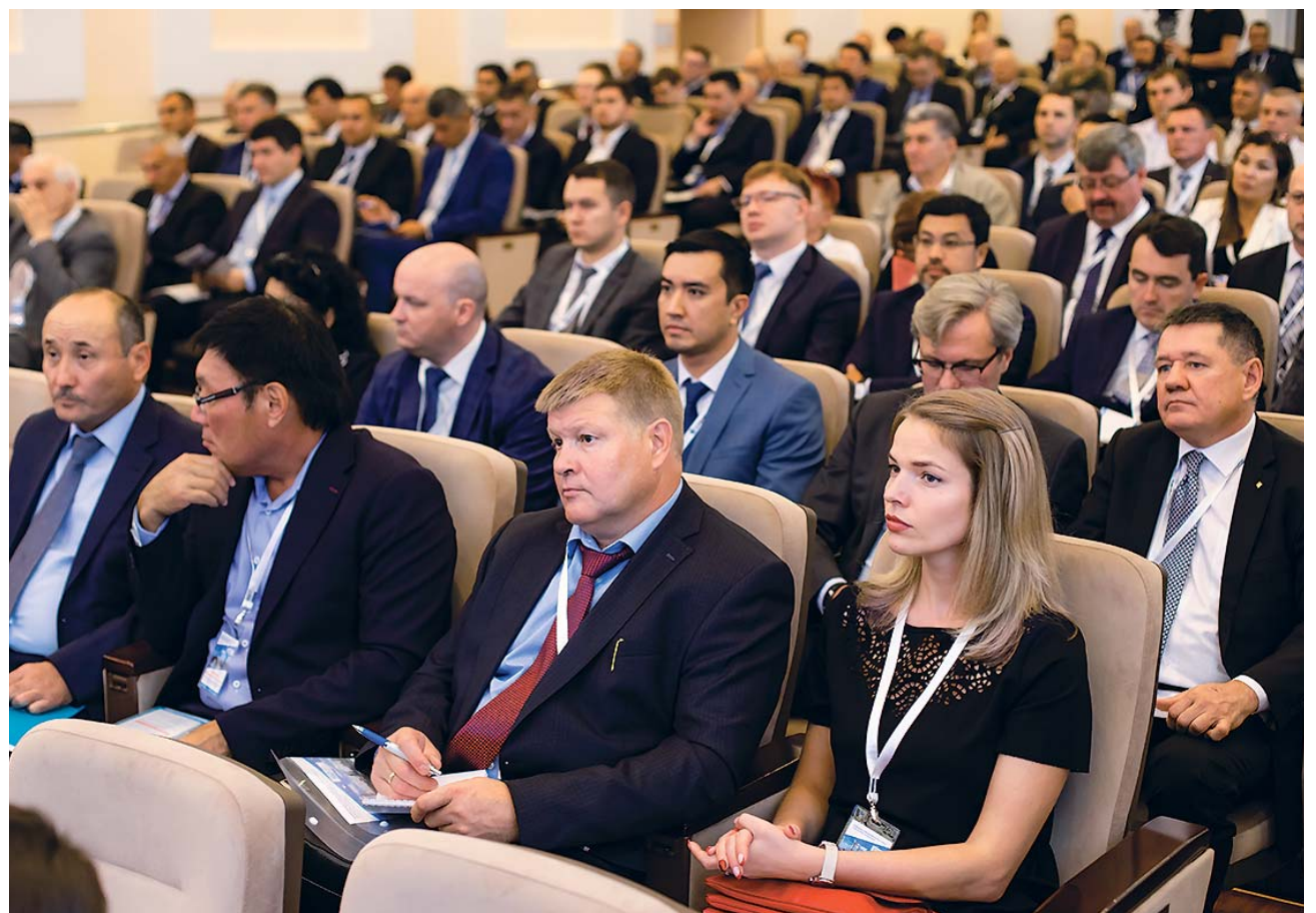
Участники конференции на пленарном заседании