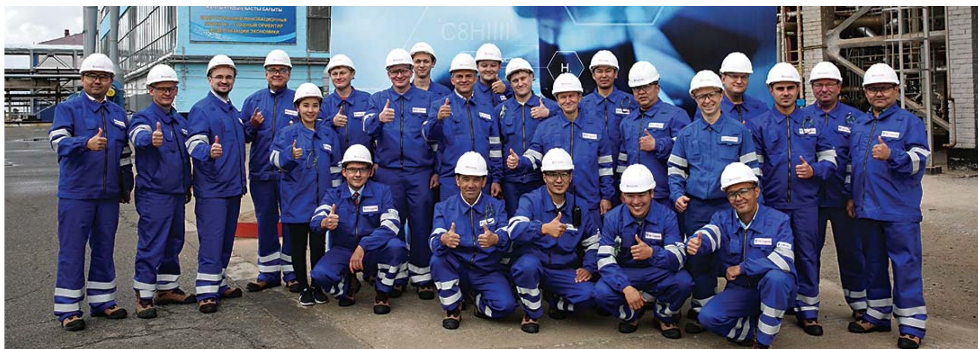
Коллектив ТОО «Эр Ликид Мунай Тех Газы» на установке производства водорода

Отдел по связям с общественностью ТОО «Павлодарский нефтехимический завод», отдел коммуникаций Air Liquide.