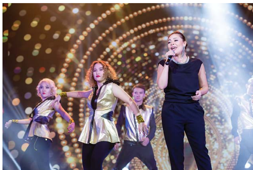
Музыкальное поздравление от Дильназ Ахмадиевой

Анна Гронская.