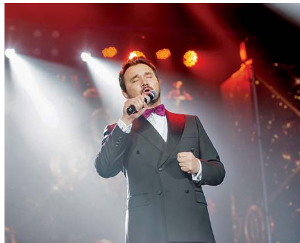
На сцене – золотой баритон Казахстана Сундет Байгожин