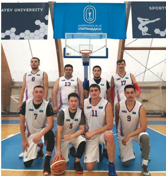
Команда баскетболистов ТОО «ПНХЗ» – I место