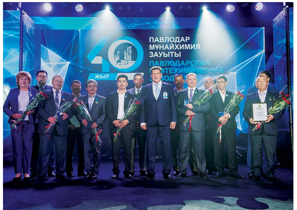
Награждение заводчан на торжественном собрании в ГДК в честь 40-летнего юбилея Павлодарского нефтехимического завода