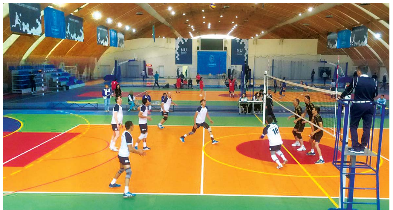
В игре – команда волейболистов ПНХЗ