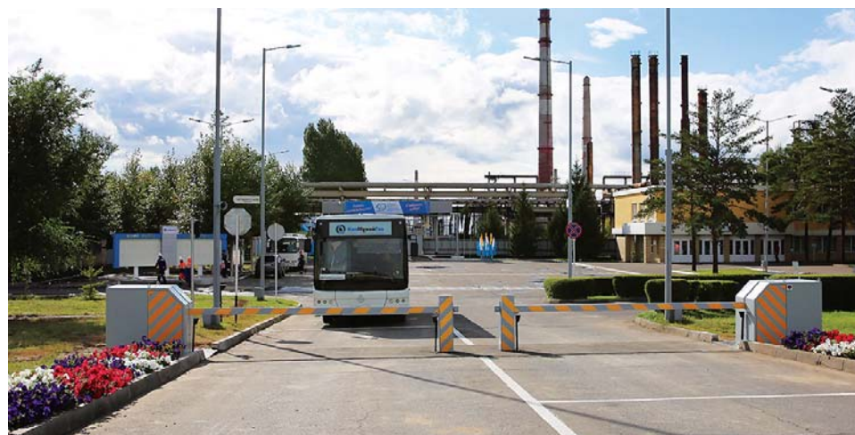
Новый противотаранный шлагбаум ПТШ-Л4500ЭМ

- проектирование и производство дорожно-заградительных и противотаранных средств для обеспечения безопасности государственных учреждений и стратегических объектов;