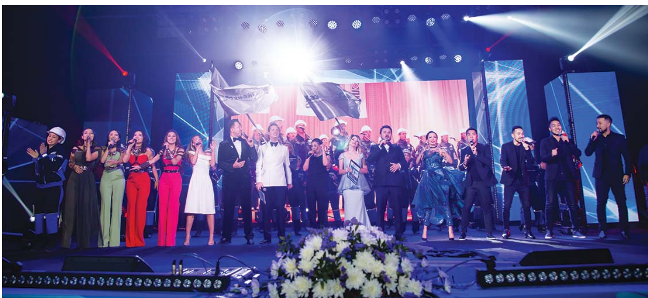
Торжественное собрание в ГДК им. Естая к юбилею ПНХЗ