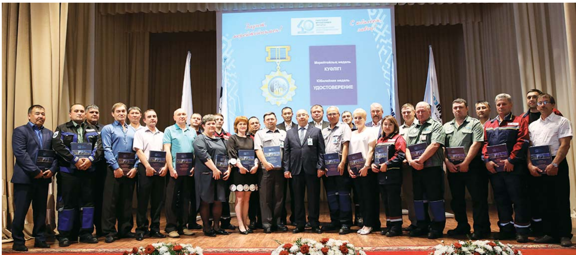
Награждение работников ПНХЗ в актовом зале заводоуправления

Анна Гронская.