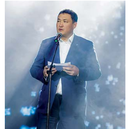
Нефтепереработчиков поздравляет аким Павлодарской области Булат Бакауов