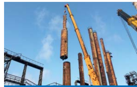
НА ЗАМЕНУ – КОЛОННА-БЛИЗНЕЦ