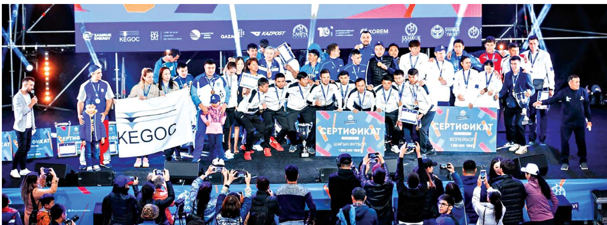
Награждение команды по стритболу

Свидетельство о постановке на учет, переучет периодического печатного издания, информационного агентства и сетевого издания №17667-Г от 16.04.19 г. Выдано Комитетом информации Министерства информации и коммуникаций Республики Казахстан.