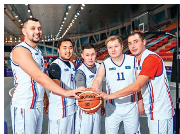
Команда ПНХЗ по стритболу