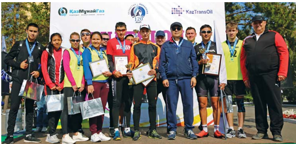
Награждение победителей и участников дуатлона

Участниками соревнования стали работники завода, партнерских организаций – ТОО «Тотал Сервис», ТОО «ENERGY SERVICE – PVL», ТОО «Кузет-Павлодар», ТОО «Топливо-транспортная компания», ТОО «iQS-Engineering», Павлодарского нефтепроводного управления АО «КазТрансОйл», представители АО «НК «КазМунайГаз», ТОО «Атырауский нефтеперерабатывающий завод», ТОО «ПетроКазахстан Ойл Продактс», приехавшие на встречу Советов молодых специалистов.