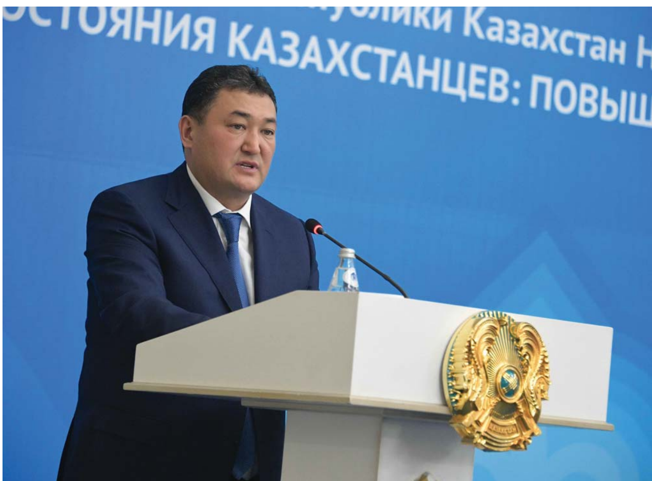
Булат Бақауов, аким Павлодарской области