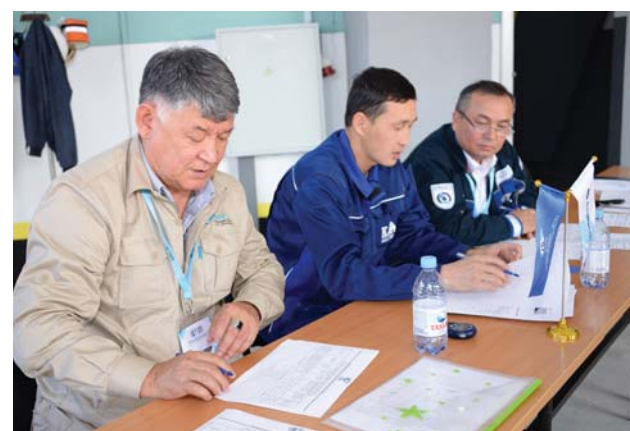
Жюри конкурса в номинации «Оператор технологических установок»