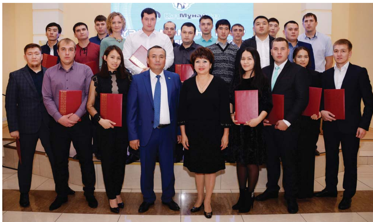
Победители заводского этапа конкурса ТОО «ПНХЗ» «Үздік маман»