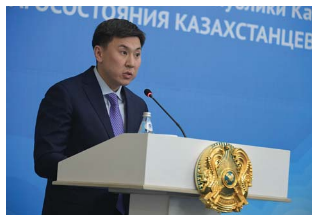
Ануар Кумпекеев, аким города Павлодара