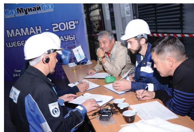
Работа членов жюри на площадке конкурса среди машинистов технологических насосов