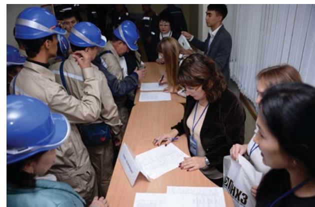
Регистрация участников конкурса