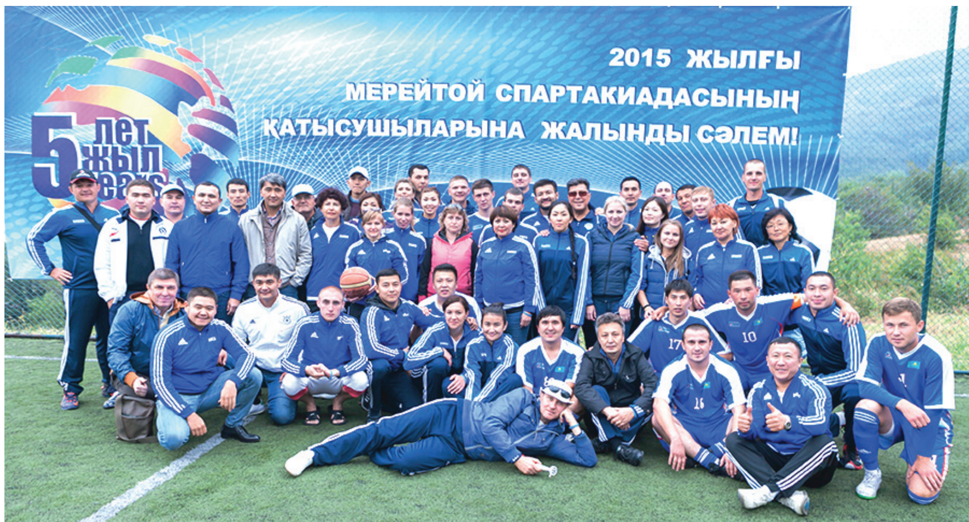
Павлодарские участники спартакиады

АО «КазМунайГаз – переработка и маркетинг» – 100-процентная дочерняя организация АО НК «КазМунайГаз». В активе компании – ТОО «Атырауский НПЗ» (99,53%), ТОО «ПетроКазахстан Ойл Продактс» (49,7%), ТОО «Павлодарский НХЗ» (100%), ТОО «КазМунайГаз-Өнімдері» (100%), ТОО СП «Caspi Bitum» (50%). Основные направления деятельности: управление нефтеперерабатывающими активами, экспорт нефти и нефтепродуктов, развитие розничной сети реализации нефтепродуктов.