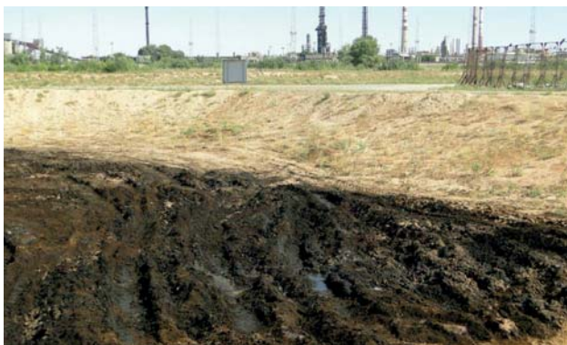
Нефтяной кек и замазученный грунт на заводском полигоне до обезвреживания

Пункт первый 288-й статьи Экологического кодекса диктует, чтобы предприятия, в процессе хозяйственной деятельности которых образуются отходы разного класса опасности, предусматрива-