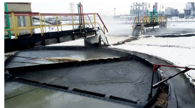
Флотационная пена на флотаторах

А вот флотационную пену и донные нефтешламы переработать на этой установке не представляется возможным: установка для этих целей не предназначена.