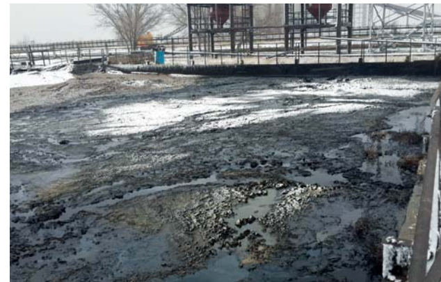
Донные нефтешламы в шламонакопителе

Вторая проблема, связанная с очисткой сточных вод, – это донный нефтешлам. Он собирается в аварийных амбарах нашего предприятия и содержит большое количество механических примесей (песка и других абразивных веществ),