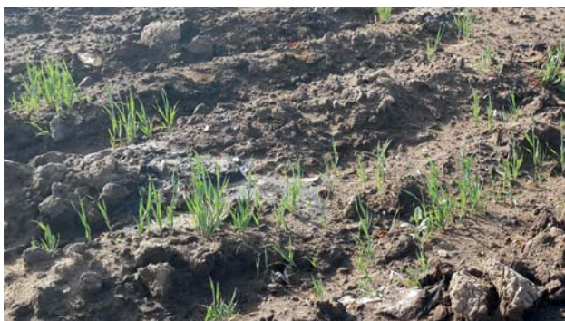
Овес, проросший на обезвреженных отходах

ли меры безопасного обращения с ними, соблюдение экологических и санитарно-эпидемиологических требований и выполнение мероприятий по их утилизации, обезвреживанию и безопасному удалению. В процессе нефтепереработки по нормативам на заводе образуется 2 370 тонн отходов янтарного уровня опасности. Среди них нефтяной кек – 1 867 тонн и замазученный грунт – 503 тонны. Если бы эти отходы были захоронены на полигоне отходов ПНХЗ, то за их размещение в окружающей среде предприятие заплатило бы за два года 59 млн тенге. Но с 2013 года, следуя требованиям кодекса и заводской программе мероприятий по охране окружающей среды, для работ по обезвреживанию этих отходов ПНХЗ привлечена подрядная организация – компания «Альфа Вид».